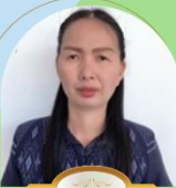
นางแสงจันทร์ ก็นหา ผู้ดูแลเด็ก